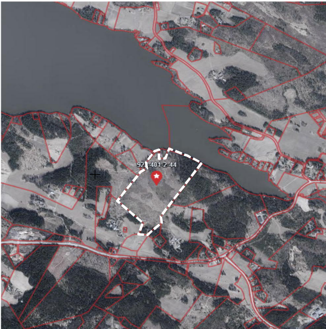
Kuva 1 Ilmakuva. Suunnittelualueen likimääräinen raja-alue valkoisella katkoviivalla.

401 (Keihonen) Nälkäniementie, 37470, Vesilahti