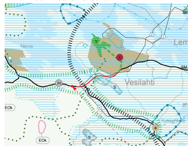
Kuva 2. Ote Pirkanmaan maakuntakaavasta 2040.